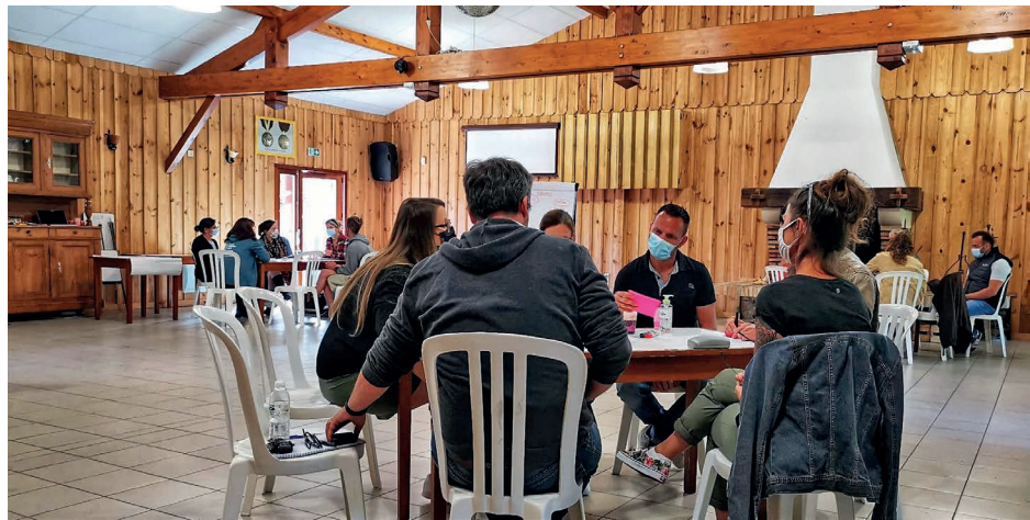
Le marketing de service de l'OT Biscarosse Grands Lacs, a été co-construit en réseau, en 2021.

À la Mona, auprès des organismes de tourisme de Nouvelle-Aquitaine, nous nous efforçons de travailler en profondeur sur l'organisation des coopérations, sur l'organisation du travail, sur la meilleure place de chacun dans une équipe, sur l'évolution nécessaire des compétences, sur la transmission des savoirs de pair-à-pair. Ces le-